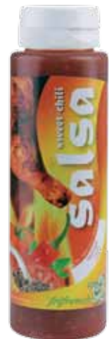
Salsa Sweet Chili